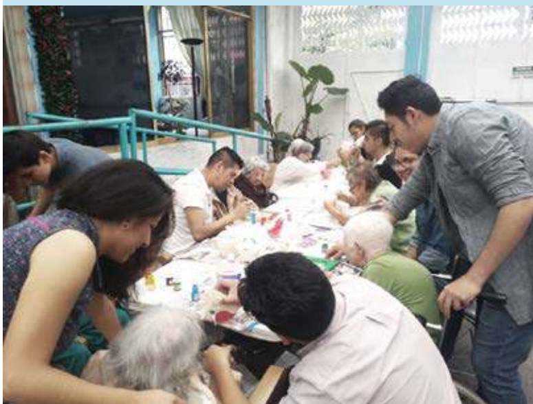
Visita al asilo Luz Azteca.