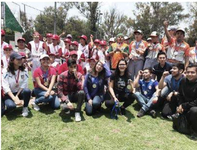
Torneo Liga Lindavista, Liga Petrolera, Special Olympics, la categoría Challenger de William Sport y la Asociación Civil CAPA.